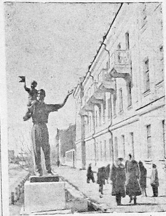
Гор. Ворошилов, улица Чичерина.